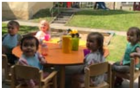
Unsere Kleinsten beim Mittagessen im Freien