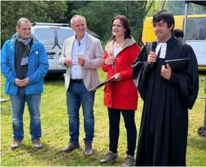
Andacht zum Hohe-Schrecke-Tag in Donndorf