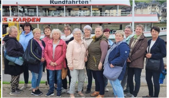
Mütterkreis-Ausflug nach Koblenz