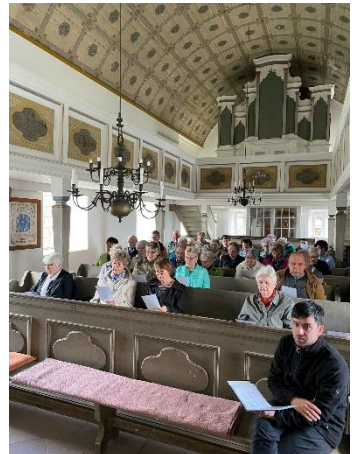
Gemeinde- ausfahrt mit Andacht in der Kirche von Nikolausrieth