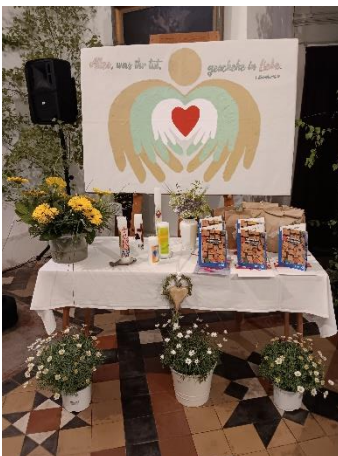
Konfirmation in der St. Andreas- Kirche Roßleben