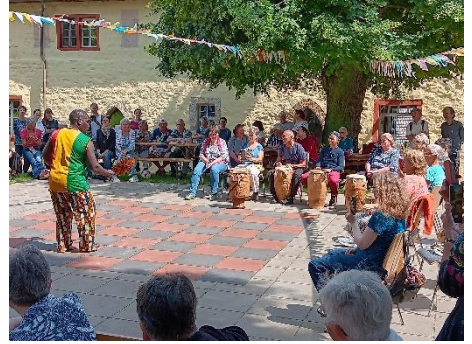
Klosterfest der Heimvolkshochschule