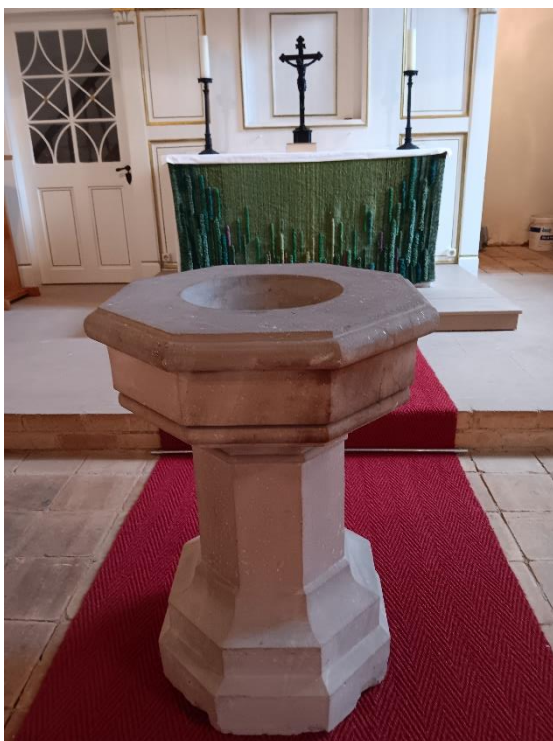
Taufstein in der Garnbacher St. Nikolai-Kirche

für die Kirchengemeinden Allerstedt, Donndorf, Garnbach, Gehofen/Nausitz, Kloster Donndorf/Kleinroda, Langenroda und Wiehe