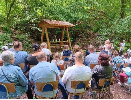
Taufe im Wolfstal bei Langenroda