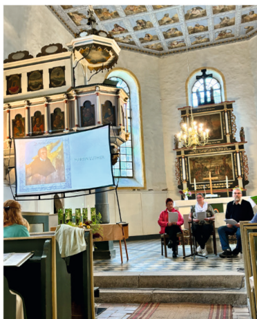
Unter dem Motto "Geschichte neu erleben" wurde Petri-Kirchweih gefeiert!