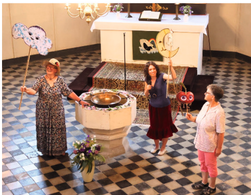
...ein besonderer Orgel-Sommer-Samstag (nicht nur) für Kinder in der Sömmerdaer Petrikirche!