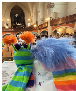
Auch Sömmerdaer Kinder nahmen am grossen Kinderchortag "500 Jahre Gesangbuch" in Erfurt teil. Es war ein ereignisreicher, schöner Tag mit viel Musik und Begegnung!